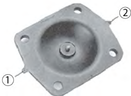
Рис. № 5: Передняя сторона эластомерной диафрагмы