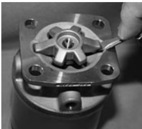
Рис. № 8: Демонтаж компрессора