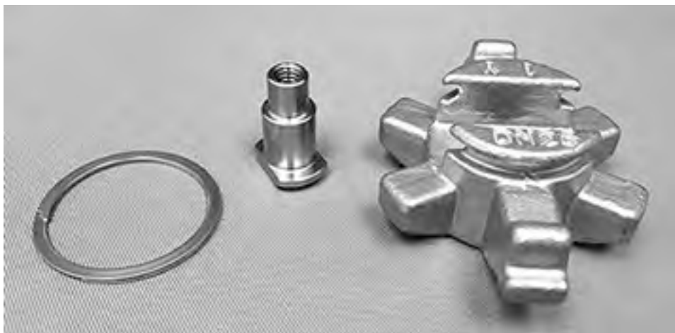
Рис. № 9: Компрессор в сборе