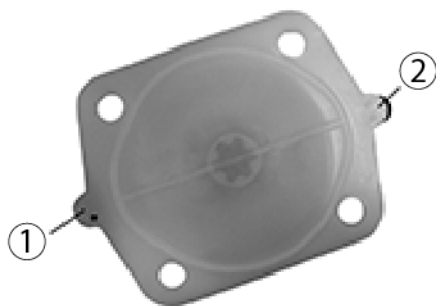
Рис. № 6: Задняя сторона эластомерной диафрагмы